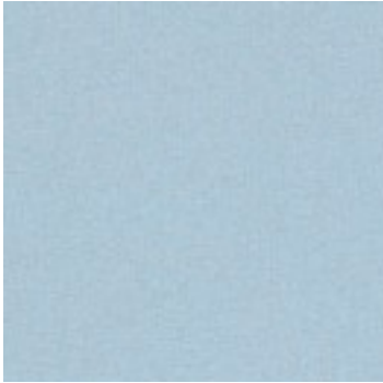
05124.033 BABY BLUE